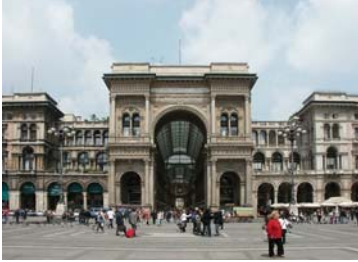
Milano, Galleria Vittorio Emanuele II—sede CSCS